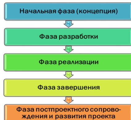
Рис. 7. Фазы проекта

Веха – контрольная точка, значимый, ключевой момент (например, переход на новую стадию, новый этап в ходе выполнения проекта). Информация, доступная в начале проекта, зачастую недостаточна для детального планирования, но ее вполне достаточно для составления плана по вехам, в котором представлены основные, ключевые события проекта: концепция проекта утверждена; план разработки проекта утвержден; разработка завершена; внедрение завершено и т.д. (Рис. 8).