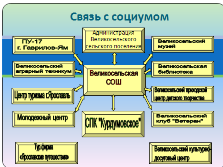
Рис. 11. Социальные партнёры