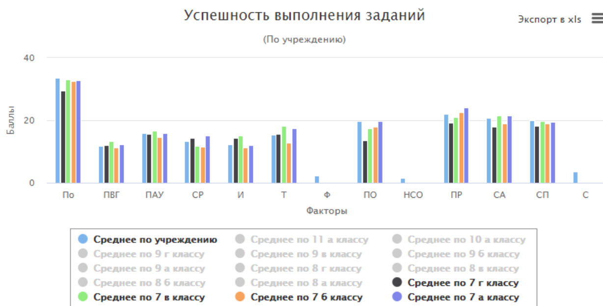
Рис.1. Сравнение профилей параллели 7 классов со средними значениями по школе