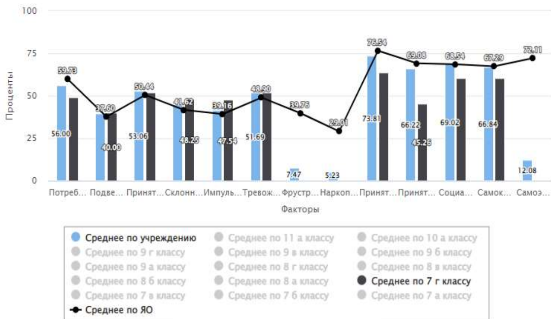
Рис. 2. Сравнение профилей класса и средних значений по школе и по ЯО

Анализ результатов по признаку пола свидетельствует о том, что у девочек отмечен более высокий уровень тревожности и более низкий уровень стрессоустойчивости, чем у мальчиков (см. рис. 3,4). В тестировании участвовали 19 человек, из них 13 мальчиков и 6 девочек.