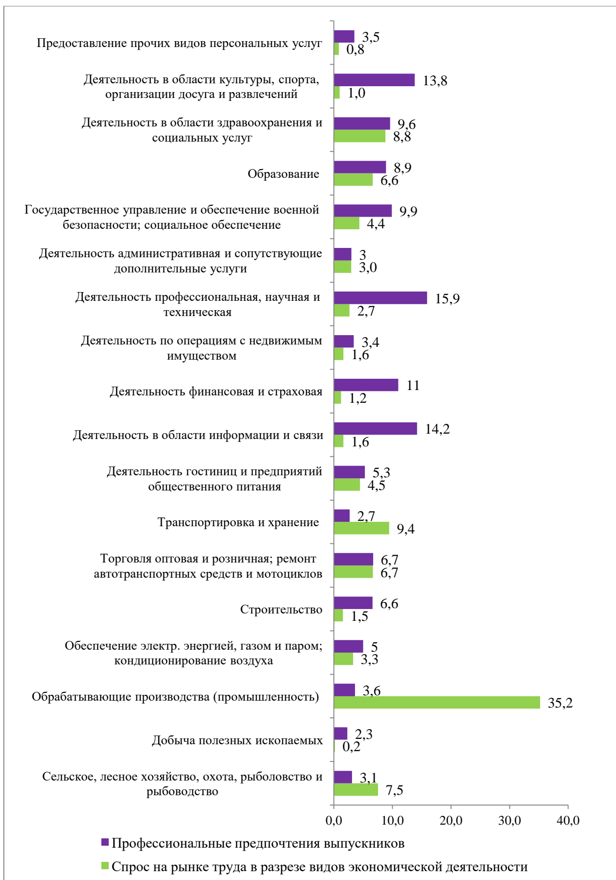
Рис. 2. Соответствие выбранным выпускниками видов экономической деятельности спросу на рынке труда Ярославской области в разрезе ВЭДов.