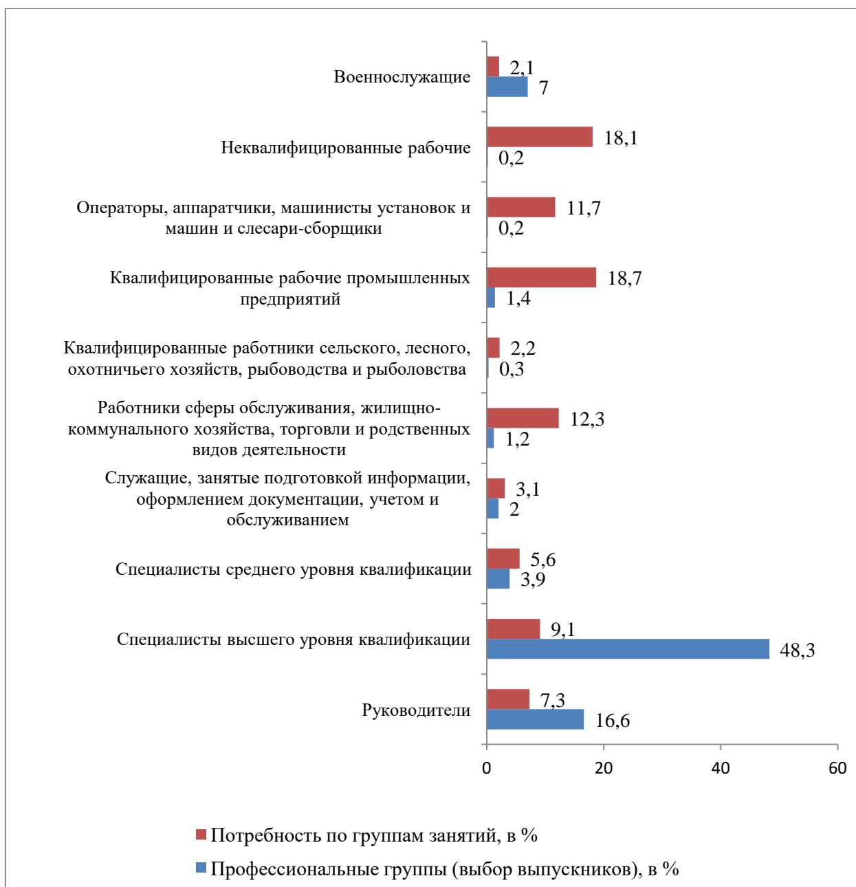
Рис. 1. Соответствие выбора выпускниками профессиональных групп потребности на регистрируемом рынке труда.

По результатам мониторинга проф. планов выделим проблему отчетного года – сохраняющийся низкий уровень выбора, несмотря на рост, по особо востребованной на рынке труда группе квалифицированных рабочих промышленных предприятий . Выбор данной группы составил лишь 1,4% (в 2019/2020 уч. г. – 0,8). Реальная потребность экономики этой профессиональной группы – 50% (см. рис. 1).