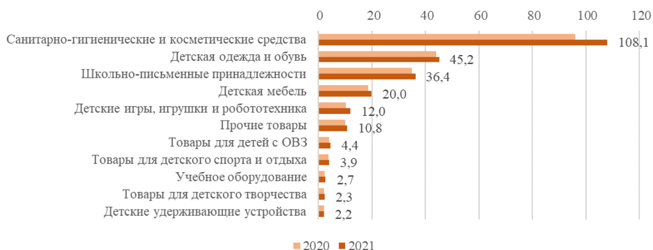
Прогноз производства товаров для детей в 2021 г., млрд руб.

Объем рынка товаров для детей в 2020 году составил 832 млрд рублей (2019 г. – 843 млрд рублей), при этом на 1 600 российских производителей пришлось 228 млрд рублей.