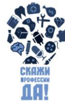
«Скажи профессии ДА!»