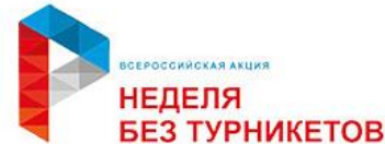
«Неделя без турникетов»