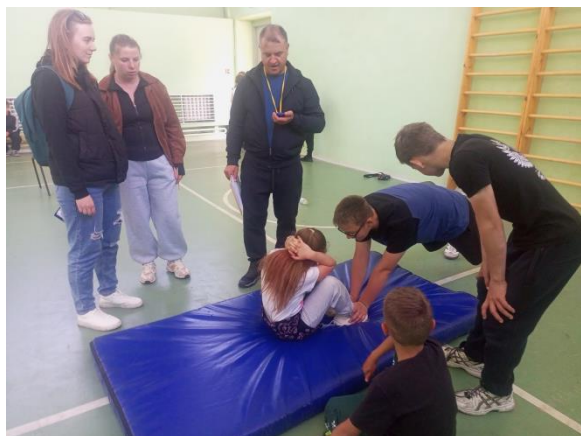
Проект «Вызов первых»